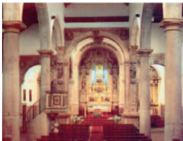
Bên trong Đền Thờ Thánh Thể Cực Trọng, Santarém

Phép Lạ Thánh Thể xảy ra ở Santarém cùng với Phép lạ Thánh Thể ở Lanciano, là hai trong những Phép lạ quan trọng nhất. Có nhiều nghiên cứu và kiểm chứng của Tòa thánh về Phép lạ này. Bánh thánh trở nên Thịt dầm máu, và Máu tuôn ra từ Minh Thánh. Cả hai thánh tích vẫn được lưu giữ tại nhà thờ Thánh Stêphanô ở Santarém.