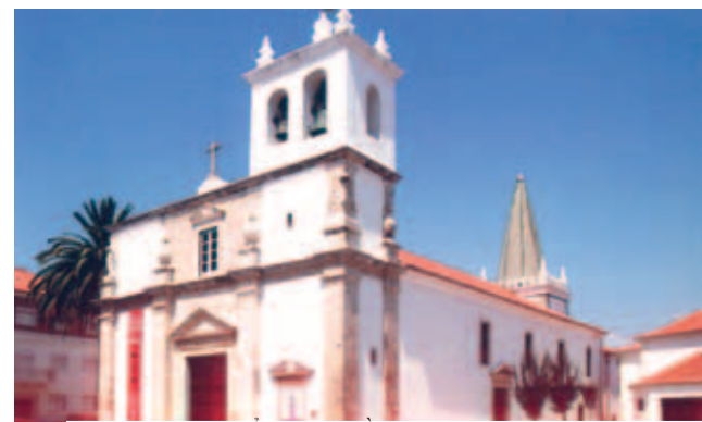
Nhà thờ Thánh Thể Nhiệm Mầu, Santarém