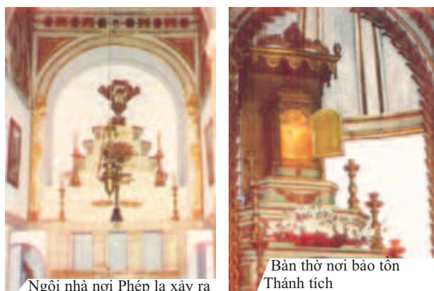
Ngôi nhà nơi Phép lạ xảy ra