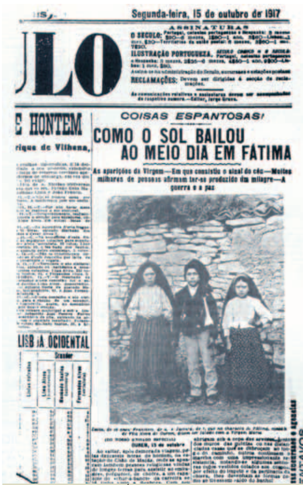
Hình chụp cuộc hiện ra cuối cùng ngày 13 tháng 10, 1917, mặt trời “nhảy múa”.