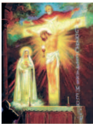
Tranh họa diễn tả cuộc hiện ra khi Đức Mẹ muốn chị Lucy tiết lộ về việc ăn năn đền tội vào năm ngày thứ bảy đầu tiên của mỗi tháng.