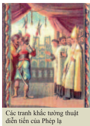
Các tranh khắc tường thuật diễn tiến của Phép lạ