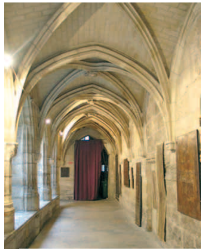
Dòng kín Billettes này nay trở nên nhà thờ Tin lành