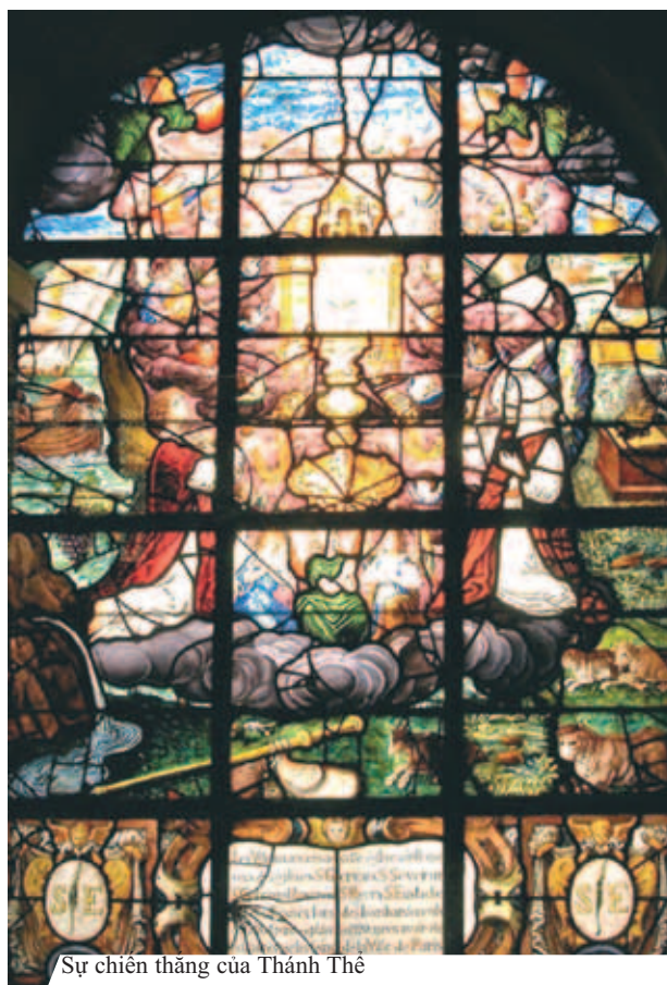
Sự chiến thắng của Thánh Thể