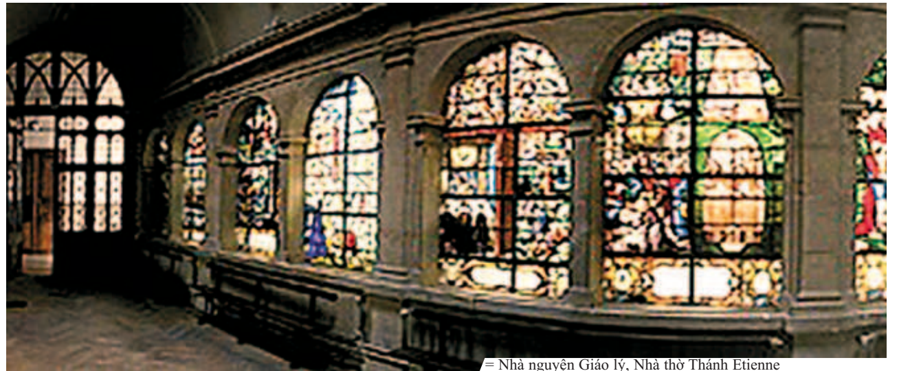
= Nhà nguyện Giáo lý, Nhà thờ Thánh Etienne

Quá tuyệt vọng, hắn lại ném Thánh Thể vào nồi nước đang sôi. Thánh Thể cất bông lên cao và biến thành hình thánh giá.