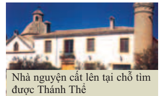
Nhà nguyện cất lên tại chỗ tìm được Thánh Thể