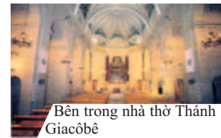
Bên trong nhà thờ Thánh Giacôbê