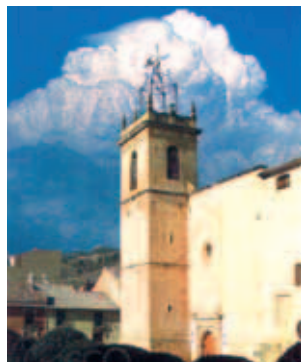
Nhà thờ Thánh Giacôbê Tông đồ, nơi lưu giữ Thánh Thể nhiệm màu