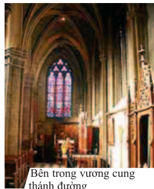
Bên trong vương cung thánh đường