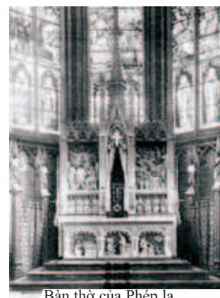
Bàn thờ của Phép lạ