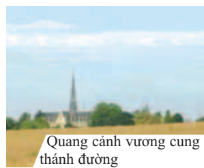
Quang cảnh vương cung thánh đường