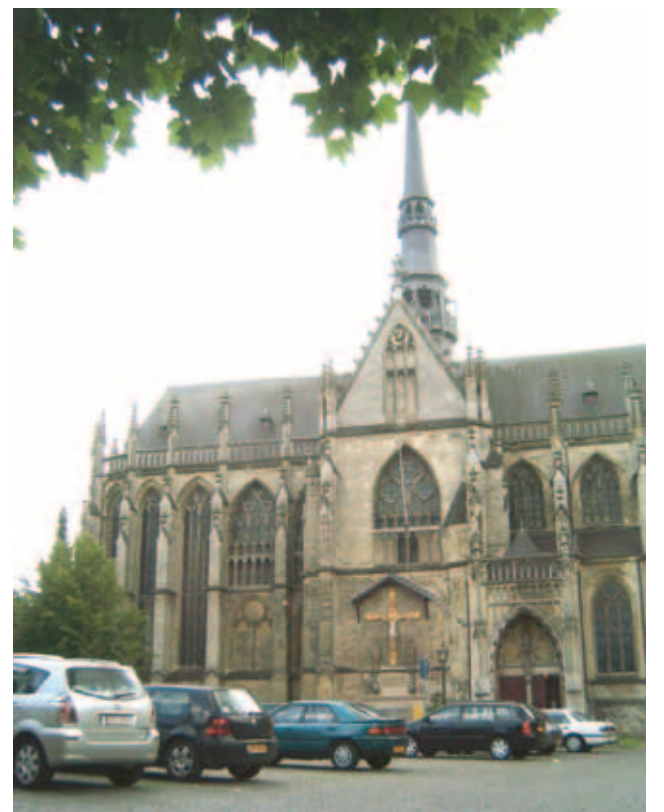
Wương cung thánh đường Bí tích Cực Thánh, Meerssen