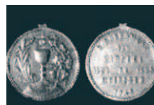
Mé đại kỷ niệm Phép lạ