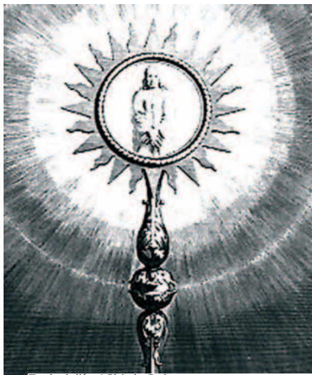
Tranh cổ điển tả Phép lạ, Paris

Trong Phép lạ Thánh Thể ở Les Ulmes xảy ra trong khi Thánh Thể được trưng bày cho mọi người chiêm bái. Khuôn mặt một người đàn ông xuất hiện trong Thánh Thể, với mái tóc màu nâu nhạt chấm vai và một khuôn mặt rạng ngời, một bàn tay của Người đặt trên bàn tay kia; và Người mặc một chiếc áo trắng dài chấm gót chân. Sau khi đã kiểm chứng kỹ lưỡng, Đức Giám mục đã ban lệnh cho tôn kính Phép lạ Thánh Thể. Mãi cho đến nay tại nhà thờ, người ta vẫn có chiêm ngắm Mặt nhật đưng Minh Thánh được lưu giữ hơn 130 năm cho đến khi cách mạng Pháp bùng nổ.