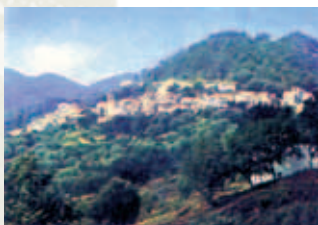
Phong cảnh San Mauro la Bruca