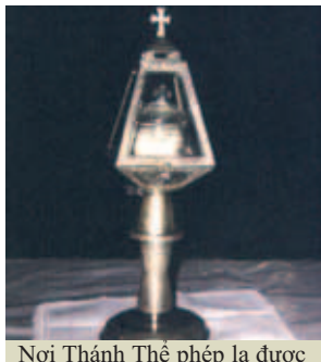
Nơi Thánh Thể phép lạ được bảo tồn