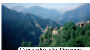
Vùng phụ cận Dronero