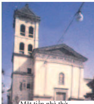
Mặt tiền nhà thờ San Mauro