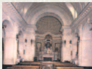
Bên trong nhà thờ