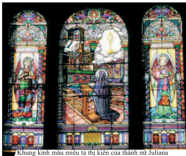
Khung kính màu miêu tả thị kiến của thánh nữ Juliana