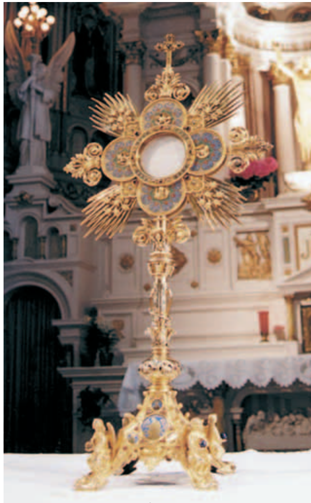
Mặt nhật lưu giữ trong Đèn thờ thánh Juliana, Liège

“Mặc dù Thánh Lễ được cử hành long trọng hàng ngày, có một ngày đặc biệt để thờ kính Minh Thánh Chúa Kitô. Chúng ta có thể thờ phượng Chúa với hết cả tâm trí và thần trí bất cứ lúc nào, nhưng chỉ có thể cảm nhận được sự Hiện diện Thực sự qua cách này mà thôi. Khi châu Thánh Thể, Chúa Giêsu thực sự ở đó với chúng ta. Chúa Kitô Phục sinh đã phán trước ngày Thăng Thiên: “Thầy sẽ ở với các con cho đến ngày tận thế” ( Mt 28, 20)... Chúa sẽ còn ở lại với họ với chính Thân Xác của Ngài.”- Theo Đức Giáo Hoàng Urban Đệ tứ; TRANSITUS DE HOC MUNDO .