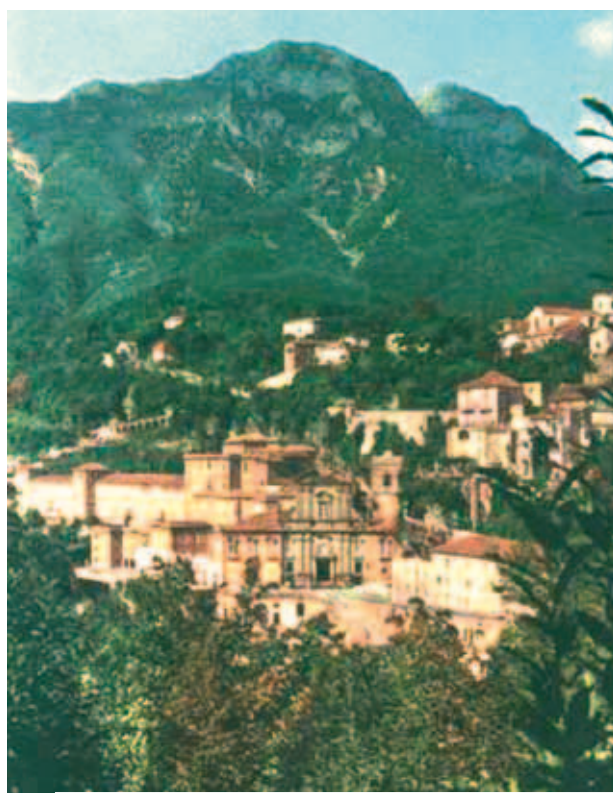
Phong cảnh ở Cava dei Tirreni

Vào tháng 5 năm 1656, theo sau việc đội binh Tây Ban Nha từ Sardinia đến xâm lược Naples, một cơn dịch ghê gớm đã tràn đến thành phố. Bệnh dịch lan ra nhanh chóng, từ những thôn làng và các vùng quê lân cận sắp tràn đến tận thành phố Cava Dei Tirreni. Con số nạn nhân ở những nơi này đã lên đến hàng ngàn người. Cha Phaolô Franco là một trong số ít linh mục không bị mắc bệnh dịch. Không ngại bị lây bệnh, cha được thần hứng để hướng dẫn dân chúng rước kiệu ăn năn tội ở một nơi cách đỉnh núi Castello vài cây số. Khi tất cả mọi người lên đến đỉnh núi, cha Franco liền ban phép lành Thánh Thể cho thành phố Cava Dei Tirreni. Sau đó trận dịch đang hoành hành dữ dội, lại chấm dứt một cách kỳ diệu. Cho đến hiện nay, hàng năm cứ vào tháng 6, dân chúng cử hành một cuộc rước kiệu long trọng để tưởng niệm Phép lạ.