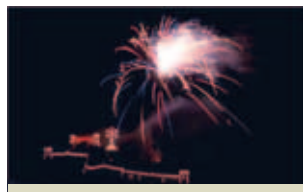
Lễ đốt pháo bông ở Cava hàng năm để kỷ niệm Phép Lạ