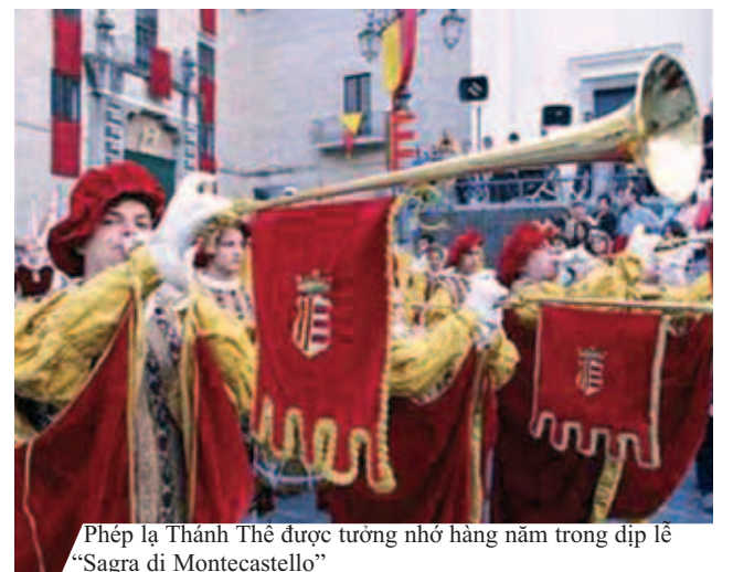
Phép lạ Thánh Thể được tưởng nhớ hàng năm trong dịp lễ “Sagra di Montecastello”