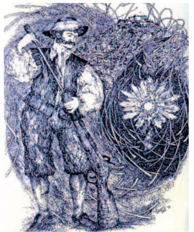
Một bản in cổ điển (thế kỷ thứ 18) miêu tả Phép lạ