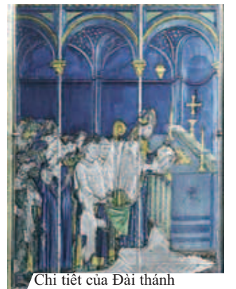
Chi tiết của Đài thánh