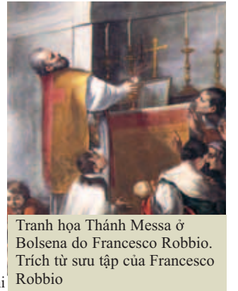
Tranh họa Thánh Messa ở Bolsena do Francesco Robbio. Trích từ sưu tập của Francesco Robbio