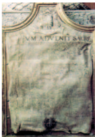
Tài liệu ghi về Phép lạ, chứng thực do Cesare Severo Durantino