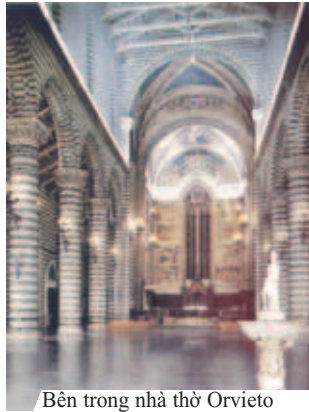
Bên trong nhà thờ Orvieto