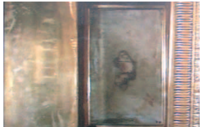
Mặt nhật có thánh tích - dính máu của phép lạ, Bolsena