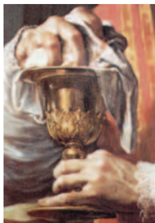
Phép lạ Bolsena, chi tiết