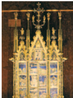
Đài thánh Minh Thánh Chúa, họa sĩ: Ugolino d'Illario (1338), Orvieto