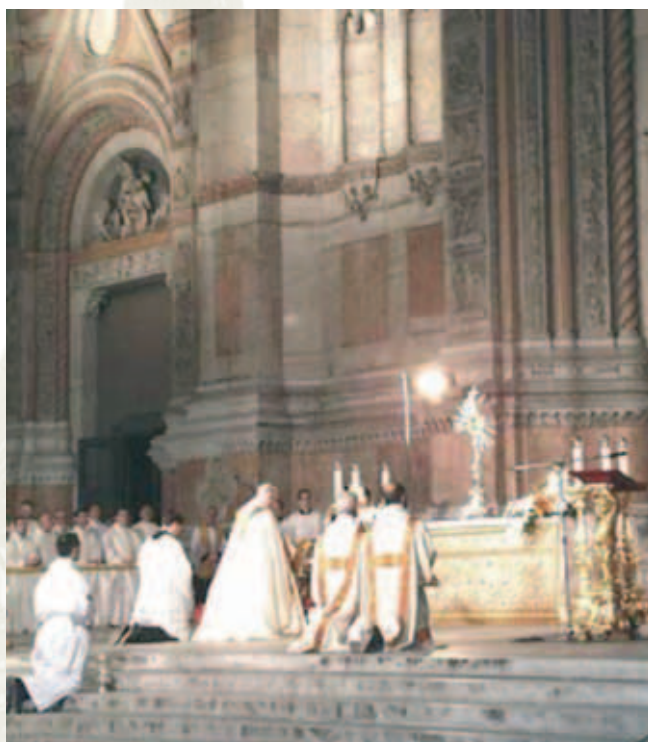
Chầu Thánh Thể kính Lễ Minh Máu Thánh Chúa, Orvieto