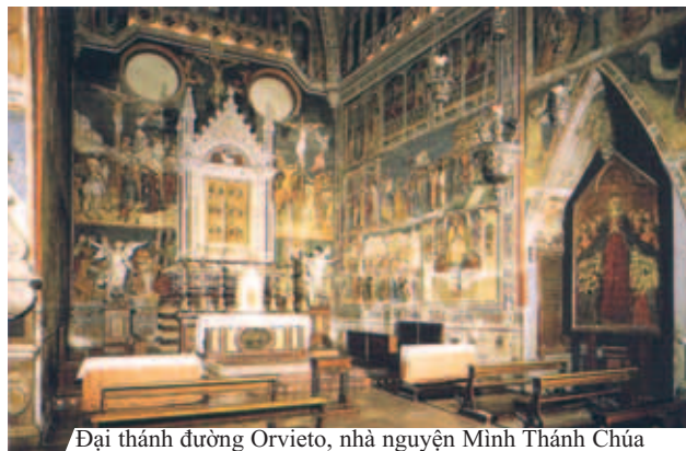
Đài thánh đường Orvieto, nhà nguyện Minh Thánh Chúa