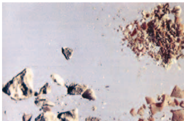
Những Phần Bánh Thánh của Phép lạ