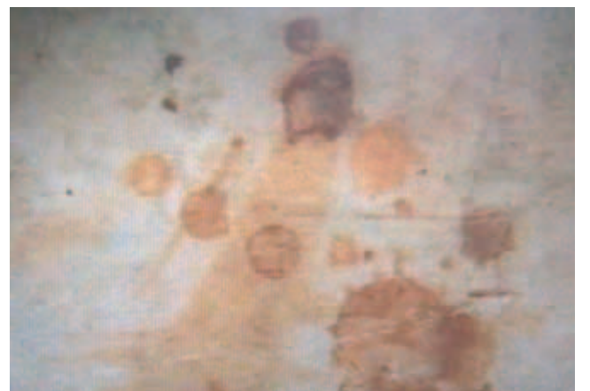
Chi tiết miếng đá dính Máu