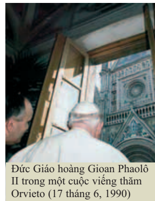
Đức Giáo hoàng Gioan Phaolô II trong một cuộc viếng thăm Orvieto (17 tháng 6, 1990)