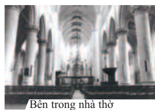
Bên trong nhà thờ