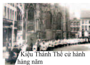
Kiệu Thánh Thể cử hành hàng năm