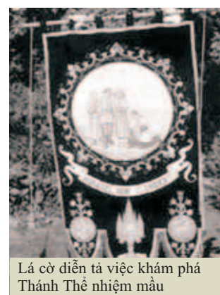
Lá cờ diễn tả việc khám phá Thánh Thể nhiệm mầu