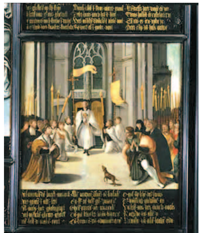
Rước kiệu Thánh tích Minh Thánh mầu nhiệm (1535), Viện Bảo tàng Thiêng liêng của Breda

thăng trầm, vào thế kỷ 20, việc tôn trung Thánh thể nhiệm mầu được phục hồi, do một dòng tu ở Breda thánh hiến cho Bí Tích Cực Thánh. Cho đến bây giờ, mỗi năm đều có kiệu Thánh thể long trọng cùng những buổi cầu nguyện để kỷ niệm Phép lạ.