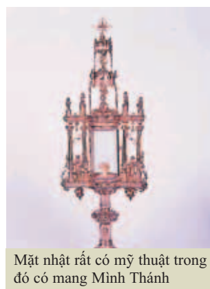
Mặt nhật rất có mỹ thuật trong đó có mang Minh Thánh