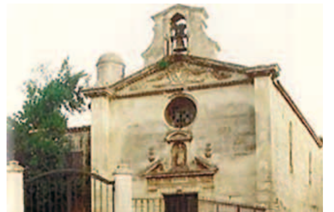
Mặt tiền Nhà nguyện của Dòng Penitents Xám