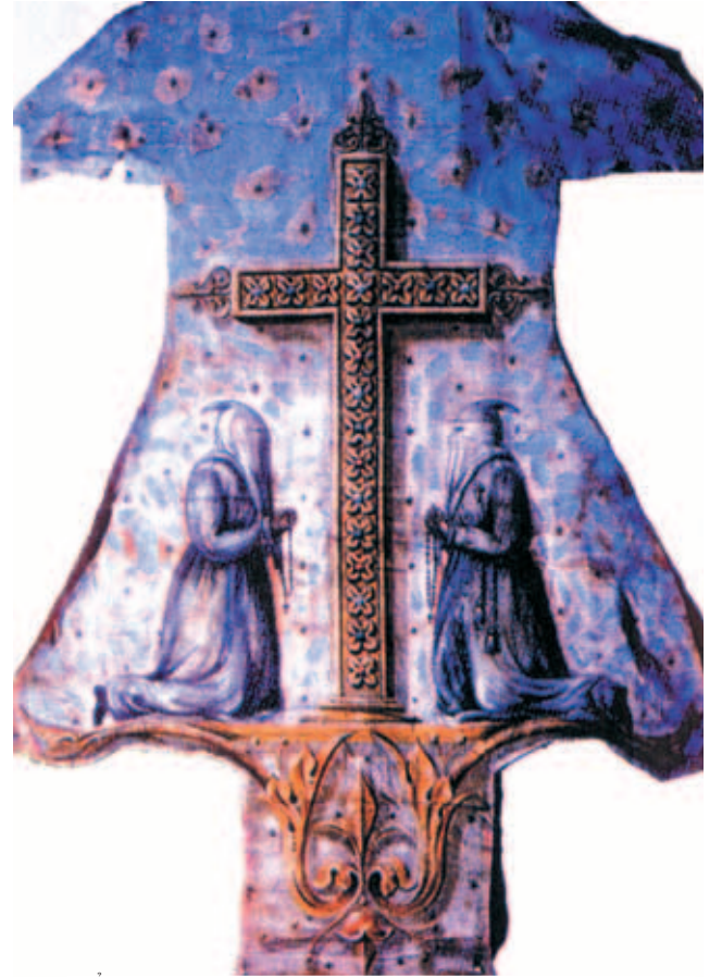
Phẩm phục của Dòng Penitents Xám