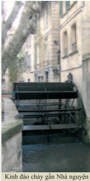
Kính đào cháy gần Nhà nguyện