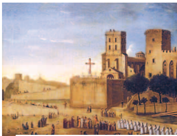
Lâu đài của các Giáo hoàng, Avignon