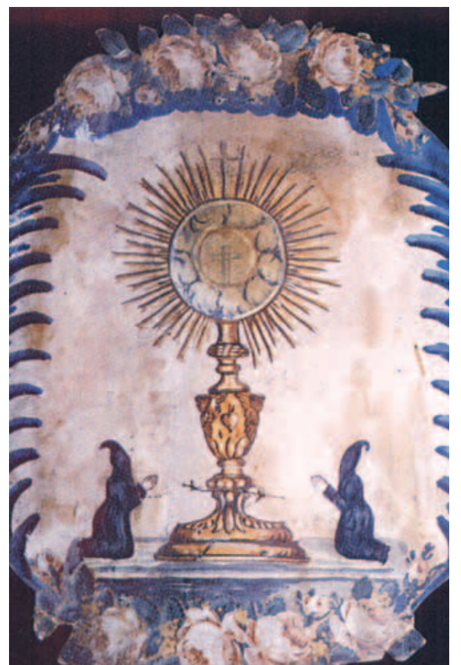
Tranh chạm fresco trong Nhà nguyện