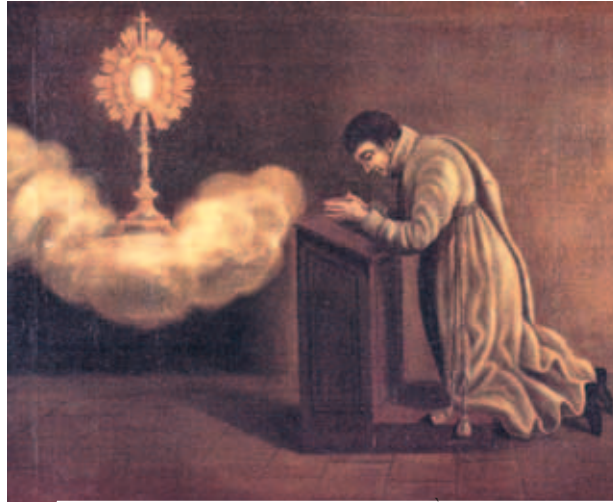
Gabriel de Vidaud Latour, nhà lãnh đạo đầu tiên của Dòng anh em Penitents Xám

Tin tức loan ra nhanh chóng, và rất nhiều người kể cả những nhà cầm quyền đến tụ họp ở nhà thờ. Họ hát những bài hát để ngợi khen và cảm tạ Chúa.