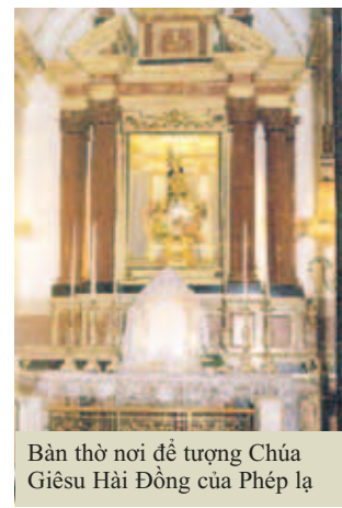
Bàn thờ nơi để tượng Chúa Giêsu Hải Đồng của Phép lạ