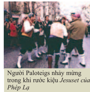
Người Paloteigs nhảy mừng trong khi rước kiệu Jesuset của Phép Lạ