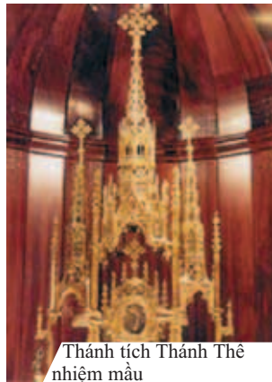
Thánh tích Thánh Thể nhiệm màu

Phép lạ Thánh Thể hiện ra ở Alcoy năm 1568 có liên hệ đến việc tìm ra cách kỳ diệu, những Thánh Thể đã bị mất. Dân chúng Alcoy vẫn ghi nhớ Phép lạ bằng các cử hành hàng năm, một cuộc Kiệu trọng thể vào ngày Lễ Mình Máu Thánh Chúa. Nhà của kẻ phạm thánh đã trở nên một nhà nguyện và có thể thăm viếng ngay cả cho đến bây giờ.