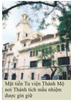
Mặt tiền Tu viện Thánh Mồ nơi Thánh tích màu nhiệm được gìn giữ