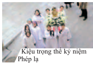
Kiệu trọng thể kỷ niệm Phép lạ