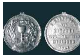
Medallas conmemorativas del Milagro