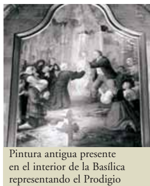
Pintura antigua presente en el interior de la Basílica representando el Prodigio