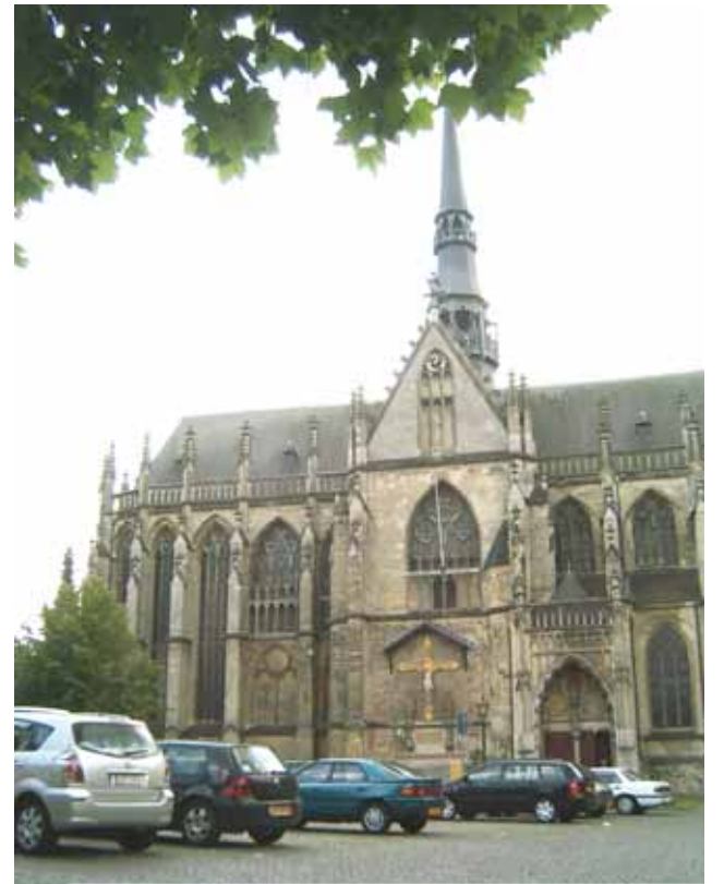
Basílica del Santísimo Sacramento, Meerssen