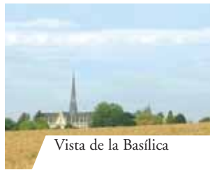
Vista de la Basílica