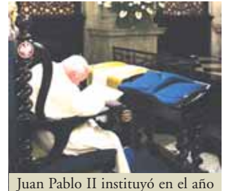
Juan Pablo II instituyó en el año 2000 la fiesta litúrgica de la Divina Misericordia para que sea celebrada cada año, el primer domingo después de la Pascua.

Jesús a Santa Faustina: "Hija Mía, ayúdame a salvar a un pecador agonizante; recita por él la corona que te he enseñado". Cuando comencé a recitar la corona, vi a aquel moribundo entre tormentos y luchas atroces. El Ángel de la Guarda lo defendía, sin embargo, era impotente ante la gran miseria de aquella alma. Una multitud de demonios estaba a la espera de aquella alma, pero mientras yo recitaba la corona vi a Jesús igual a la imagen pintada. Los rayos que salieron del Corazón de Jesús envolvieron al enfermo y las potencias de las tinieblas huyeron, no sin provocar un gran ruido. El enfermo expiró serenamente. Cuando entré nuevamente en mí comprendí que esta corona es importante junto a los moribundos, ella aplaca la ira de Dios".