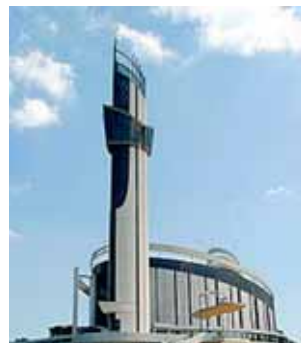
Santuario de la Divina Misericordia, Cracovia