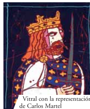
Vitrail con la representación de Carlos Martel