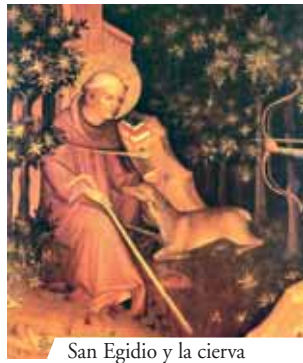
San Egidio y la cierva

Carlos Martel había cometido un pecado grave. Sobrecogido por los remordimientos decidió dirigirse hacia Provenza, para buscar a un abad muy conocido de la época que se llamaba Egidio. Su intención era pedirle la absolución de su pecado sin tener que confesarlo y manteniendo el secreto del crimen. San Egidio ofició la Misa con este fin, cuando de pronto apareció un ángel que se posó cerca el altar con un libro en la mano. En él estaba escrita la culpa inconfesable. Mientras procedía la celebración, las letras del libro fueron desapareciendo progresivamente hasta borrarse completamente. Entonces, Carlos Martel se halló absuelto.