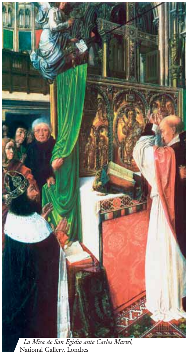
La Misa de San Egidio ante Carlos Martel, National Gallery, Londres