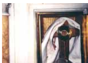
Tabernáculo donde se conservan las Hostias del Milagro