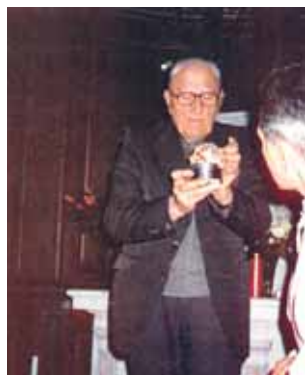
Año 1975. El párroco de la iglesia de San Pedro expone la Hostia de 1254

Accidentalmente, dejó caer una Hostia consagrada. Inclinandose para recogerla, ésta se elevó sola hasta posarse en el purificador. Luego, en vez de ella, apareció un espléndido niño que fue contemplado por todos los fieles y religiosos presentes en la celebración. A pesar de que son ya más de 800 años desde que ocurrió el Milagro, aún hoy es posible admirar la Hostia del Milagro. Todos los jueves del mes, en la iglesia de San Pedro de Douai, se reúnen numerosos fieles en un ambiente de oración delante de la Hostia Prodigiosa.