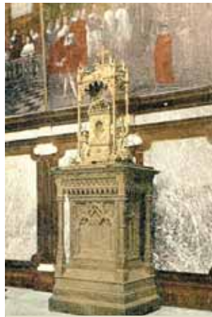
Reliquia de la Sangre del Prodigio, iglesia de Santa Catalina