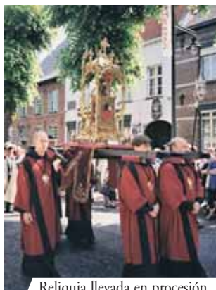
Reliquia llevada en procesión