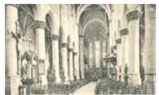
Interior de la iglesia