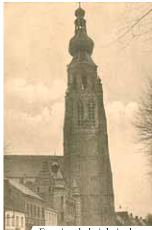
Exterior de la iglesia de Santa Catalina, Hoogstraten

Boxtel es famosa principalmente por un Milagro Eucarístico que se verificó alrededor del año 1380. Un sacerdote llamado Eligio Van der Aker estaba celebrando la Misa en el altar de los Reyes Magos. Accidentalmente, dejó caer luego de la consagración el cáliz con el vino blanco consagrado. En ese instante se transformó visiblemente en Sangre que manchó el corporal y el mantel de altar. La Reliquia del corporal teñido de Sangre se conserva aún hoy en Boxtel; en cambio, el mantel de altar fue donado a la ciudad de Hoogstraten. El documento de mayor autoridad que describe el Milagro es un decreto escrito por el Cardenal Pileus en el año 1380.