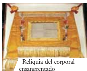
Reliquia del corporal ensangrentado