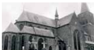
El Milagro Eucarístico se verificó en la iglesia de San Pedro en Boxtel