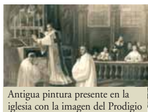
Antigua pintura presente en la iglesia con la imagen del Prodigio