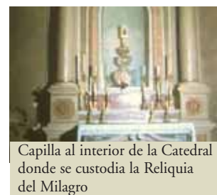
Capilla al interior de la Catedral donde se custodia la Reliquia del Milagro