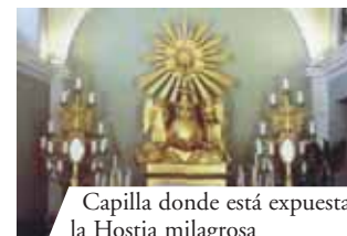
Capilla donde está expuesta la Hostia milagrosa