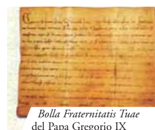
Bolla Fraternitatis Tuae del Papa Gregorio IX