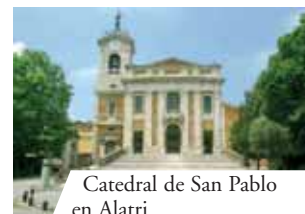
Catedral de San Pablo en Alatri