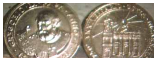
En 1978 se celebró solemnemente el 750° aniversario del Prodigio. En ocasión de la fiesta se acuñó una medalla que presenta en la parte anterior la imagen del Papa Gregorio IX con la Bula, y en la posterior, la fachada de la Catedral con la Hostia