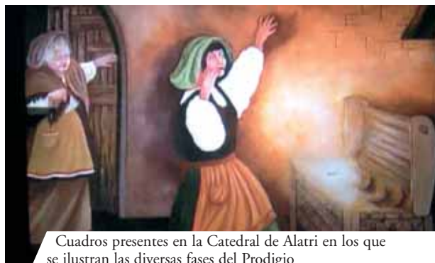
Cuadros presentes en la Catedral de Alatri en los que se ilustran las diversas fases del Prodigio

En Alatri se conserva hasta nuestros días la reliquia del Milagro Eucarístico ocurrido en el año 1228. La Catedral de San Pablo Apóstol custodia un fragmento de Hostia convertida en carne. Una mujer joven, con el fin de reconquistar el amor de su novio buscó una hechicera. Ésta le ordenó robar una Hostia consagrada para hacer con ella una brebaje de amor. Durante una Misa, la joven logró esconder una Hostia en una tela. Llegando a su casa se dio cuenta que la Hostia se había transformado en carne sangrante. Entre los numerosos documentos que certifican el hecho, destaca la Bula del Sumo Pontífice Gregorio IX.