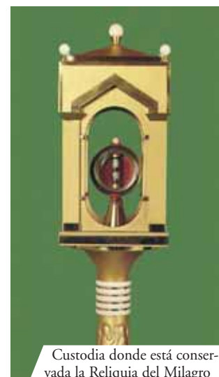
Custodia donde está conservada la Reliquia del Milagro