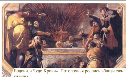
Бодони, «Чудо Крови». Потолочная роспись вблизи святилища