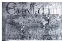
Булла Евгения IV (1442)