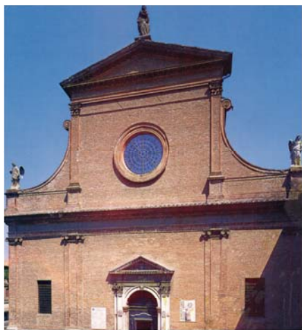
Церковь Санта-Мария-ин-Вадо, Феррара