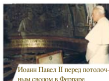
Иоанн Павел II перед потолочным сводом в Ферраре