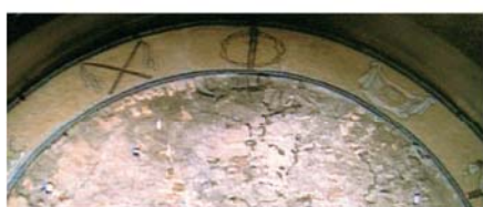
Потолочный свод с пятнами Крови