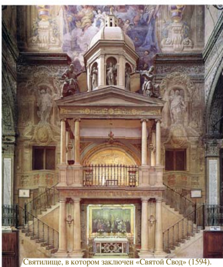
Святилище, в котором заключен «Святой Свод» (1594). Правая часть креста

Это евхаристическое чудо произошло 28 марта 1171 года в городе Феррара, в базилике Санта-Мария-ин-Вадо. В пасхальное воскресенье Мессу служил настоятель отец Пьетро да Верона. В момент преломления освященного Хлеба он увидел, как из него выплеснулась Кровь и забрызгала потолочный свод над алтарем. В 1595 году вокруг свода было выстроено маленькое внутреннее святилище, и в наши дни свод с пятнами Крови можно увидеть вблизи, посетив величественную базилику Санта-Мария-ин-Вадо.