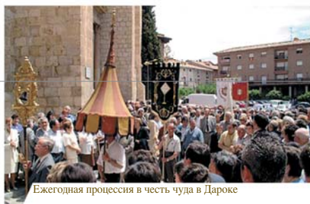
Ежегодная процессия в честь чуда в Дароке

Дон Матео привел воинов туда, где был спрятан корпорал, и они обнаружили, что Гостии пропитаны Кровью.