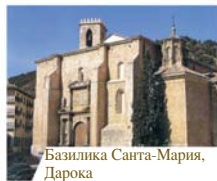
Базлика Санта-Мария, Дарока