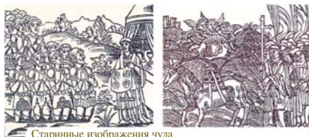
Старинные изображения чуда