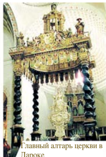
Главный алтарь церкви в Дароке