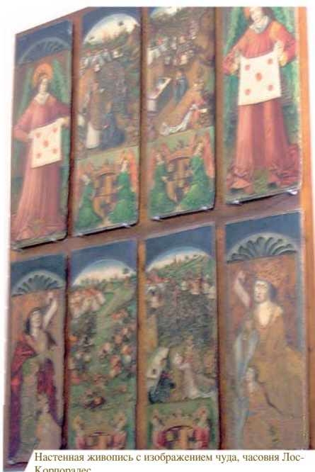
Настенная живопись с изображением чуда, часовня Лос-Корпоралес