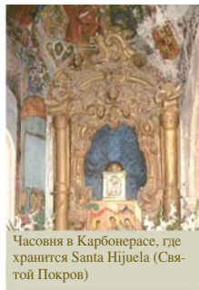
Часовня в Карбонерасе, где хранится Santa Hijuela (Святой Покров)

Дон Матео привел воинов туда, где был спрятан корпорал, и они обнаружили, что Гостии пропитаны Кровью.