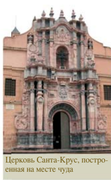
Церковь Санта-Крус, построенная на месте чуда