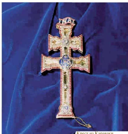
Крест из Карваки