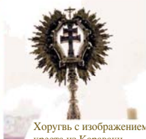
Хоругвь с изображением креста из Карваки

Во время чудесной Мессы в Карвака-де-ла-Крус на месте Гостии явился Иисус Христос, а на алтаре чудесно возникло распятие. После этого исламский король Мурсии вместе с семьей обратился в католичество. Наиболее авторитетный документ с описанием этих событий – свидетельство отца-францисканца Хиллеса де Самора.