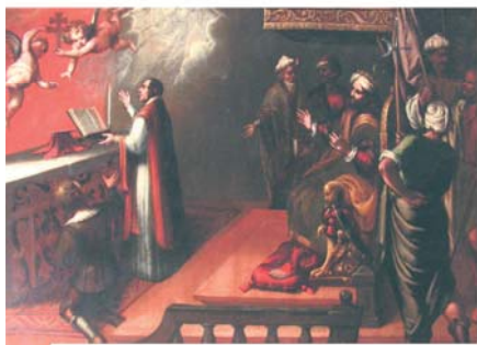
Хранящиеся в церкви старинные картины с изображением чуда