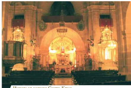
Интерьер церкви Санта-Крус