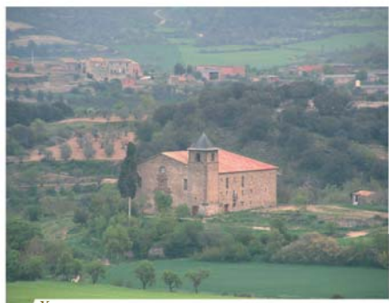
Храм, в котором произошло чудо