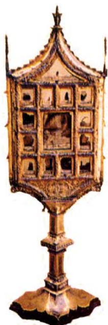
Дароносица с чудесной святыней