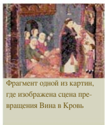
Фрагмент одной из картин, где изображена сцена превращения Вина в Кровь