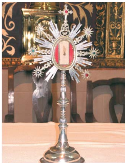
Частица корпорала с пятнами Крови