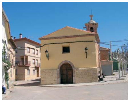
Церковь Санта-Мария в Симбалле