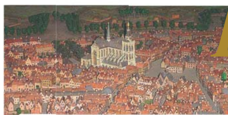
На макете представлен город Берген во времена чуда

В ergen op Zoom («Город на границе») расположен у дельты реки Шельда, и через него протекают многочисленные каналы. В 1412 году, за неделю до праздника Пятидесятницы, настоятель церкви св. Петра и Павла, не веривший в реальность пресуществления, бросил в канал освященные Гостии, оставшиеся после Мессы.