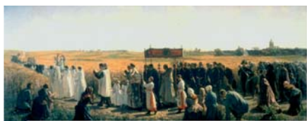
Юлес Бретон. «Процессия Пресвятого Таинства», 1857