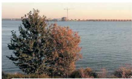
Вид на реку Шельда