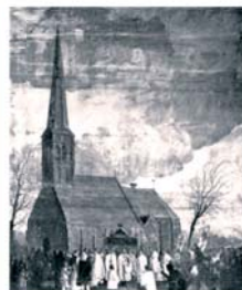
Картина, изображающая процессию в честь чуда. Институт Meertens

Через несколько месяцев рыбаки обнаружили Гостии, которые плыли по воде, покрытые пятнами свернувшейся Крови. Быстро распространилась весть о чудесном обретении Гостей, и к месту чуда стали приходить многочисленные паломники. Почитание чуда было одобрено епископом, но в годы Реформации оно долгое время было под запретом. Тем не менее католики молчаливо хранили память о нем. В XX веке почитание чуда было восстановлено, и в честь него проводятся многочисленные памятные торжества.