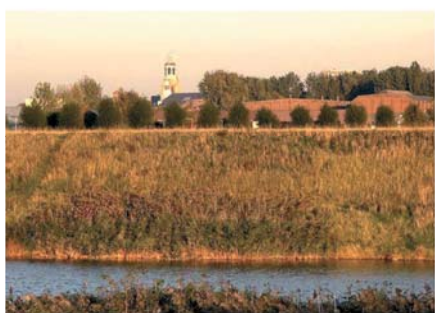
Церковь св. Петра и Павла на реке Шельда