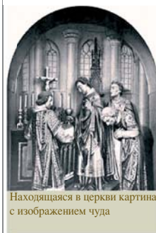
Находящаяся в церкви картина с изображением чуда