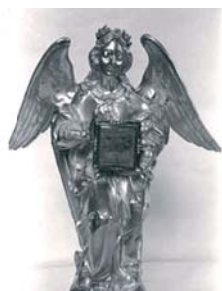
Ковчег с чудесной Кровью