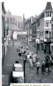
Процессия в честь чуда