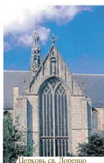
Церковь св. Лоренцо