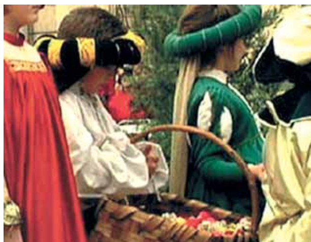
Procissão em homenagem ao Santo Sangue, Mantova