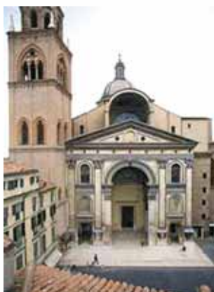
A Relíquia do Preciosíssimo Sangue de Jesus é conservada na Basílica de Santo André em Mantova