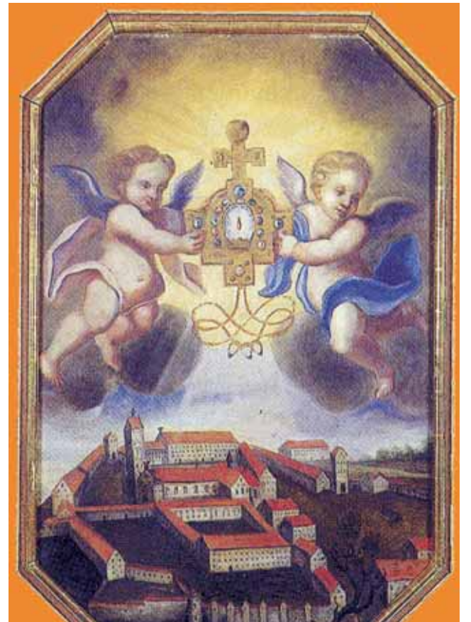
A Relíquia do Sangue Precioso (sec. XVII). Município de Weingarten