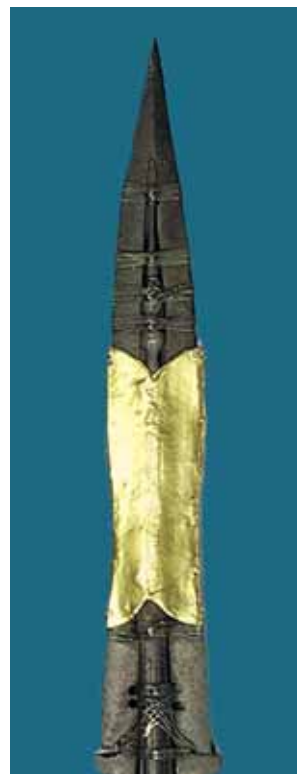
Relíquia da Lança Sagrada com a qual o soldado romano perfurou o lado de Jesus. Kunsthistorisches Museum, Viena