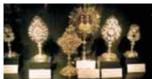
Ostensórios onde estão conservadas algumas Relíquias da Paixão de Cristo, Kunsthistorisches Museum, Viena