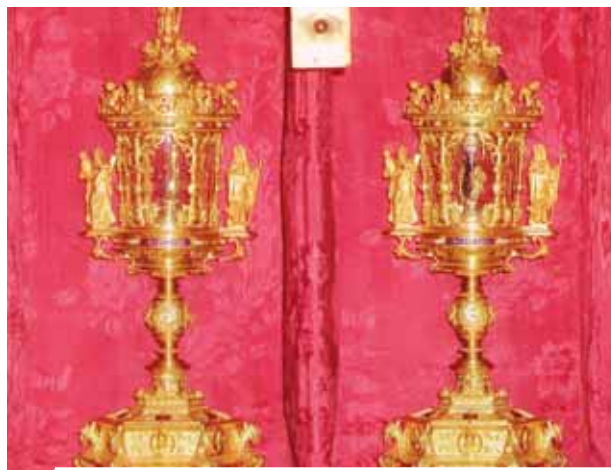
Relíquias do Santo Sangue, Mantova