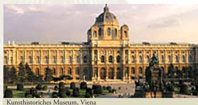
Kunsthistorisches Museum, Viena