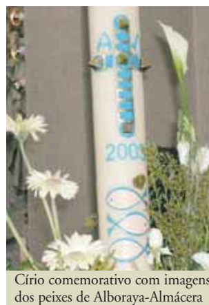
Círio comemorativo com imagens dos peixes de Alboraya-Almácer