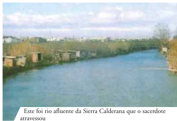
Este foi rio afluente da Sierra Calderana que o sacerdote atravessou