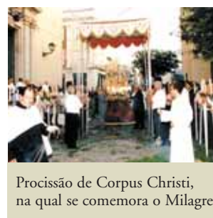
Procissão de Corpus Christi, na qual se comemora o Milagre