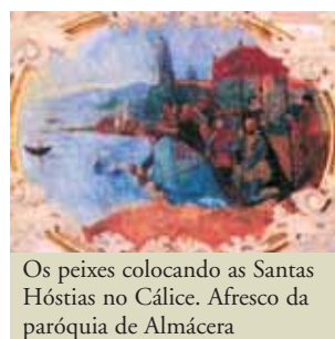
Os peixes colocando as Santas Hóstias no Cálice. Afresco da paróquia de Almácer