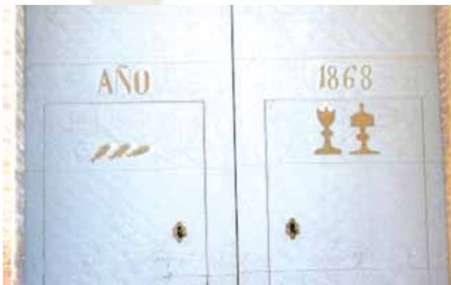
Os peixes do Milagre estão representados na porta principal da igreja