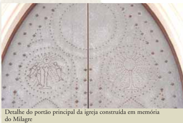
Detalhe do portão principal da igreja construída em memória do Milagre