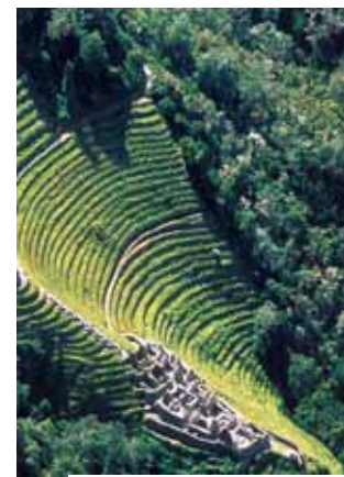
Socalcos antigos, Peru