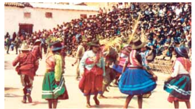
Festejos em honra do Divino Menino