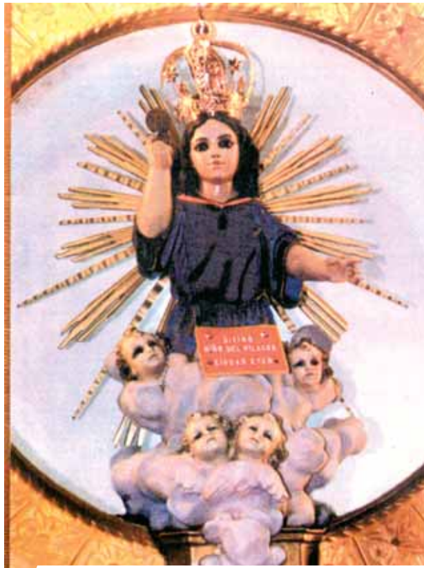
Imagem do Divino Menino de Eten

O Milagre Eucarístico de Eten acontece cerca de 356 anos atrás, na cidade peruana de Porto Eten. Na Hóstia exposta para adoração pública, apareceu o Menino Jesus e três corações resplandecentes, de cor branca, unidos entre eles. Todos os anos a festa em honra deste acontecimento começa a celebrar-se a partir de 12 de Julho, com a transladação da estátua do Divino Menino, do seu Santuário para o templo da Cidade de Eten e acaba a 24 de Julho.