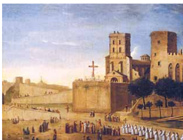
Palácio dos Papas, Avinhão