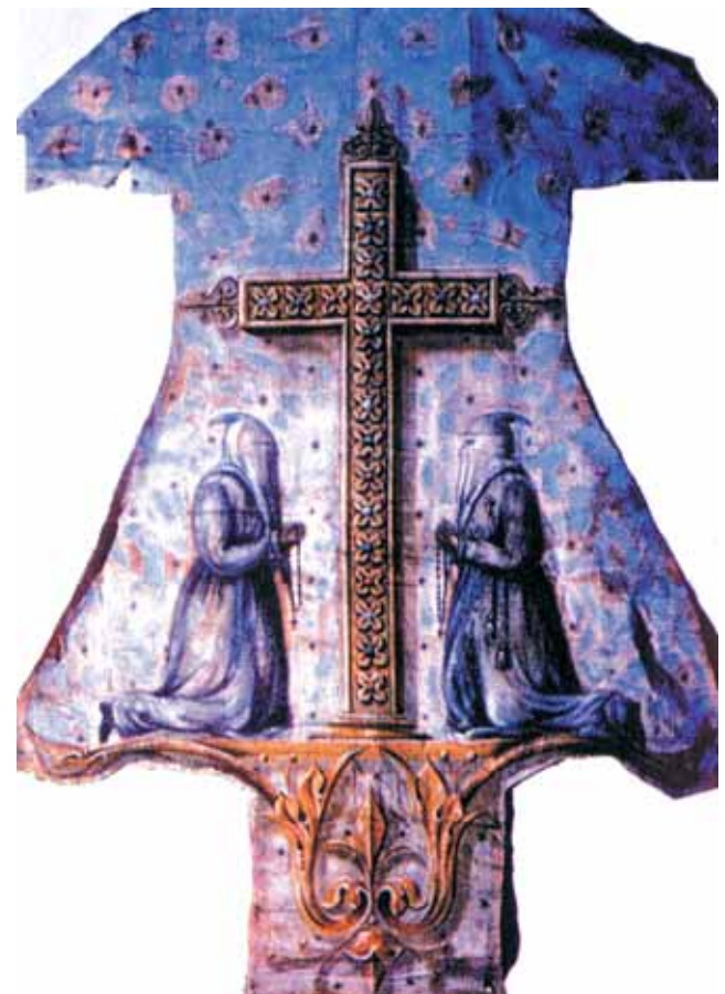
Hábito dos penitentes "Grigi"