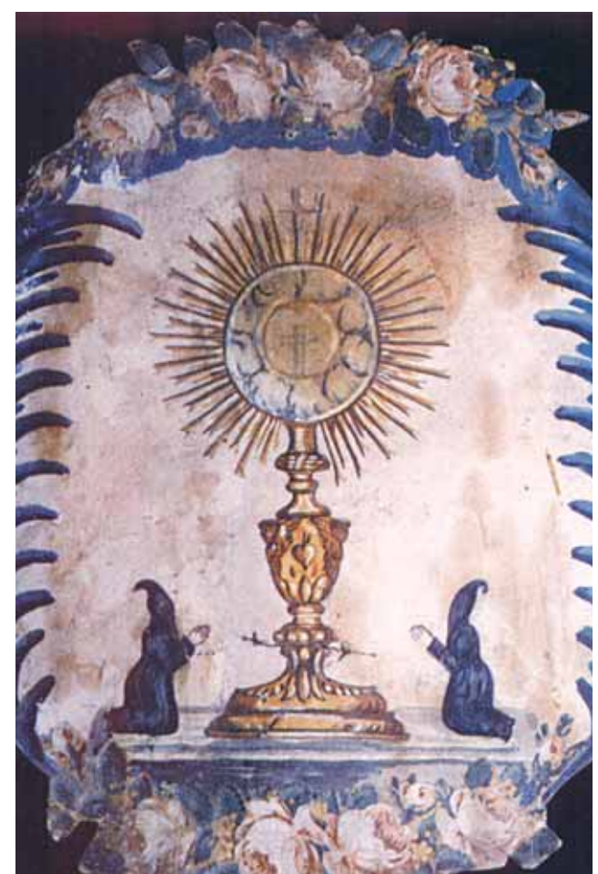
Fresco da Capela