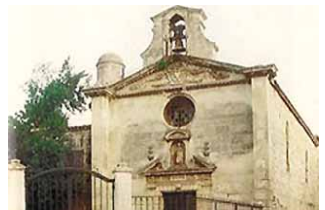
Fachada da Capela dos Penitentes "Grigi"