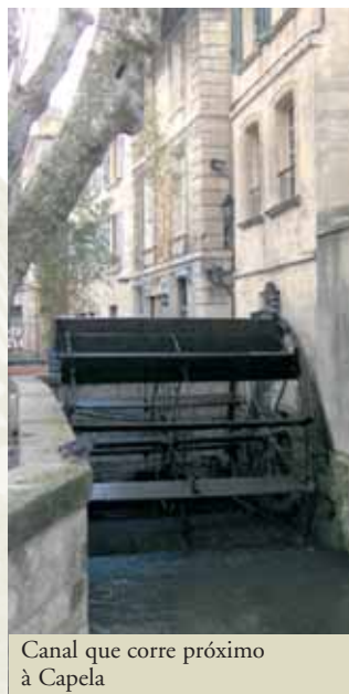
Canal que corre próximo à Capela