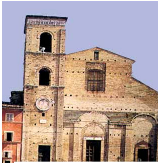
Cattedrale di Macerata

Il 25 aprile del 1356, a Macerata, un sacerdote di cui non si conosce il nome, stava celebrando la Messa nella cappellina della chiesa di Santa Caterina, di proprietà delle monache benedettine. Durante la frazione del pane, prima della Comunione, il prete cominciò a dubitare circa la reale presenza di Gesù nell'Ostia consacrata. Fu proprio nel momento in cui spezzava l'Ostia che, con suo grande spavento, vide sgorgare da questa un abbondante fiotto di sangue che macchiò parte del lino e del calice posti sull'altare.