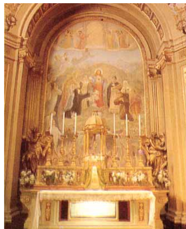
Cappella del SS.mo Sacramento dove è custodita la Reliquia

Nel 1494 fu istituita a Macerata una delle prime Confraternite in onore del SS. Sacramento (1494) e fu proprio qui che nacque la pia pratica delle Quarantore nel 1556. Ogni anno, in occasione della festa del Corpus Domini, il corporale del Miracolo viene portato in processione dietro il Santissimo Sacramento.