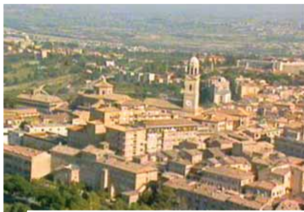
Veduta di Macerata