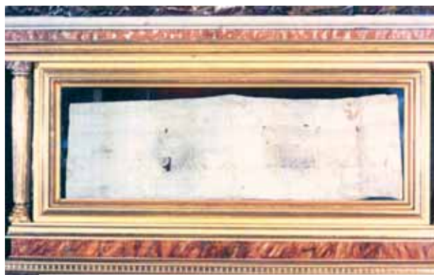
Reliquia del Corporale insanguinato