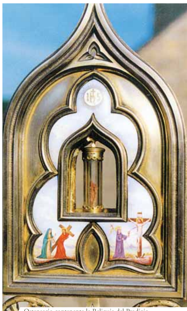
Ostensorio contenente la Reliquia del Prodigio

Nel Miracolo Eucaristico di Blanot, durante la Messa pasquale del 1331, al momento della Comunione il sacerdote fece cadere per sbaglio un frammento di Ostia consacrata sulla tovaglia. Il parroco cercò subito di recuperarlo ma non gli fu possibile. Il frammento infatti si era trasformato in Sangue formando una grossa macchia sulla tovaglia. Ancora oggi nel villaggio di Blanot si conserva la Reliquia della stoffa insanguinata.