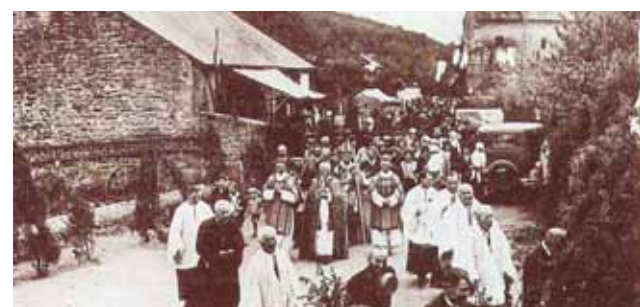
Processione in onore del Miracolo