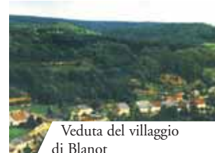
Veduta del villaggio di Blanot