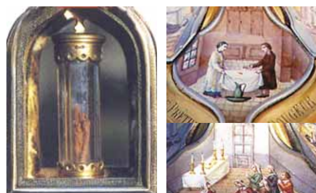
Teca del XVII secolo contenente il Tessuto macchiato di sangue che si conserva in un tubo di cristallo a Blanot