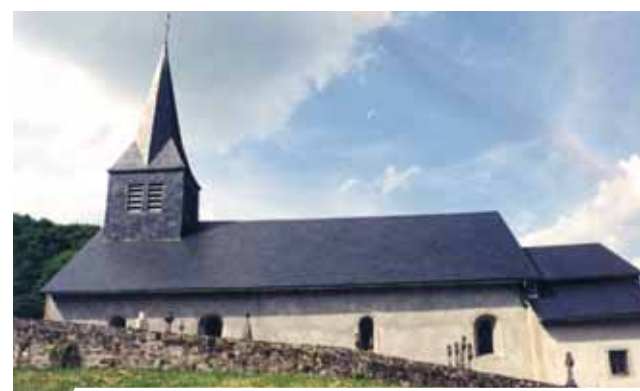
Parrocchia di Blanot