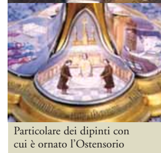
Particolare dei dipinti con cui è ornato l'Ostensorio