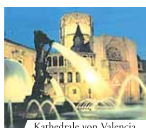
Kathedrale von Valencia