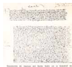
Dokument, welches die Ankunft 1437 des Hl. Gral in der Kathedrale von Valencia bezeugt