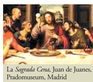
La Sagrada Cena, Juan de Juanes, Pradomuseum, Madrid