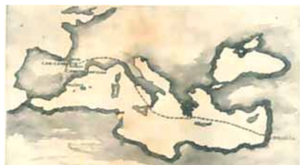
Reise des Heiligen Grals