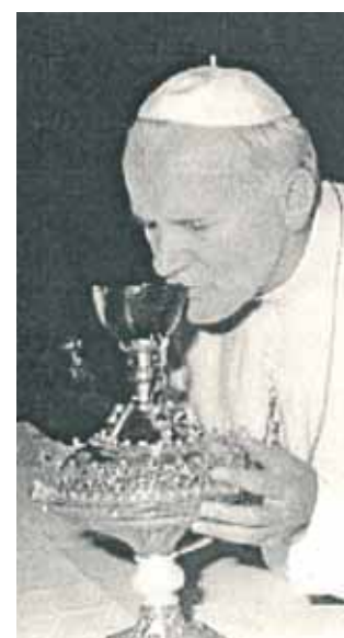
Johannes Paul II küsst den Gral