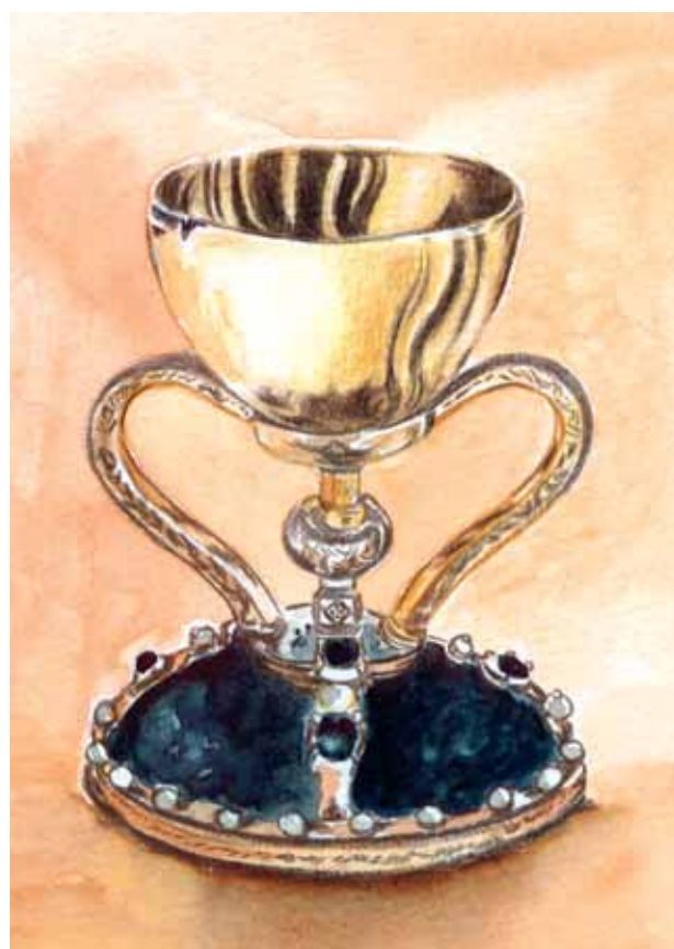
Der Heilige Gral von Valencia

Die Wahrheit über den Heiligen Gral ist oft verändert oder verschwiegen worden. Dieser wertvolle Kelch ist schon immer Gegenstand von Legenden und fantastischen Erzählungen gewesen. Legenden, wie die der Tafelrunde von König Artus in England oder die Parzivalerzählungen in Deutschland oder Frankreich des XII-XIII Jahrhunderts. Legenden, welche dann im XVIII Jahrhundert von Wagner in seinen Opern wiederaufgenommen wurden, wie auch von B. Cornwell in seinen Ende des XX Jahrhunderts geschriebenen Fantasieromanen. Noch heute ist das Thema Heiliger Gral von großem Interesse.