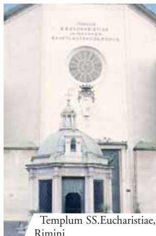
Templum SS.Eucharistiae, Rimini