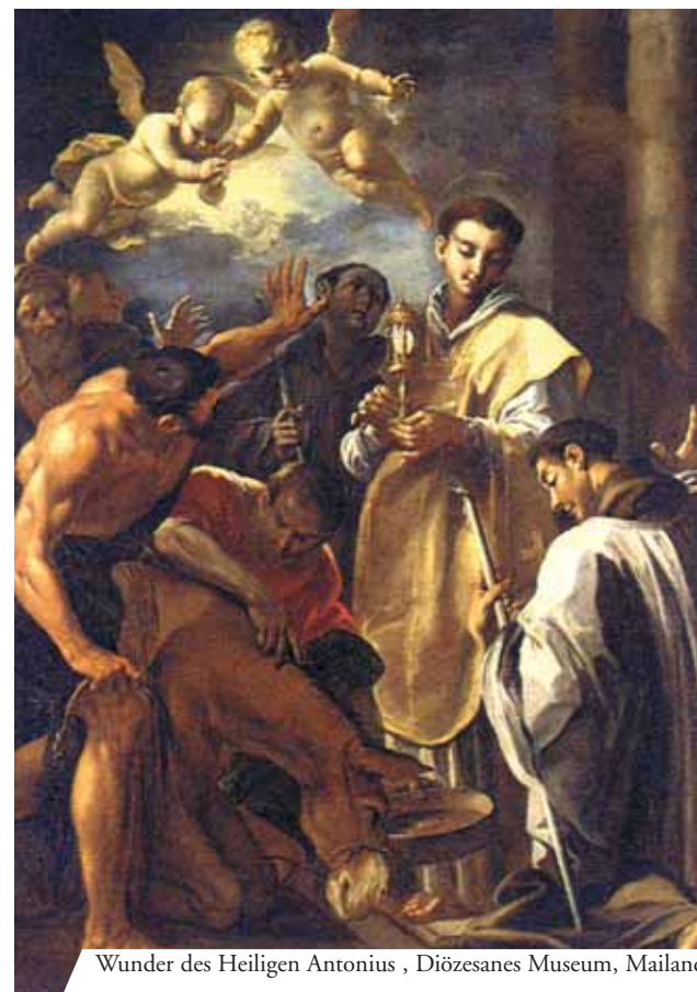
Wunder des Heiligen Antonius, Diözesanes Museum, Mailand

In Rimini steht heute noch die Kirche, die zu Ehren des Wunders von Sankt Antonius von Padua im Jahre 1227 gebaut wurde. Die Episode ist auch im Werk Begninitas erwähnt, eine der ältesten Quellen über das Leben von Sankt Antonius: der heilige Mann diskutierte mit einem Häretiker, welcher an dem Sakrament der Eucharistie zweifelte. Sankt Antonius hatte ihn fast für den katholischen Glauben gewonnen, da forderte dieser den Heiligen heraus: “Wenn du Antonio mir mit einem Wunder beweist, dass in der Kommunion wirklich der Körper von Christus ist, dann bekehre ich mich zum katholischen Glauben. Ich werde für drei Tage meinen Esel nicht füttern, danach und vor Zeugen, führe ich mein Tier vor Futter. Du Antonio, stellst dich davor mit dem, welchen du den Körper Christi nennst. Sollte