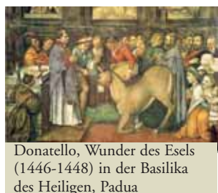
Donatello, Wunder des Esels (1446-1448) in der Basilika des Heiligen, Padua