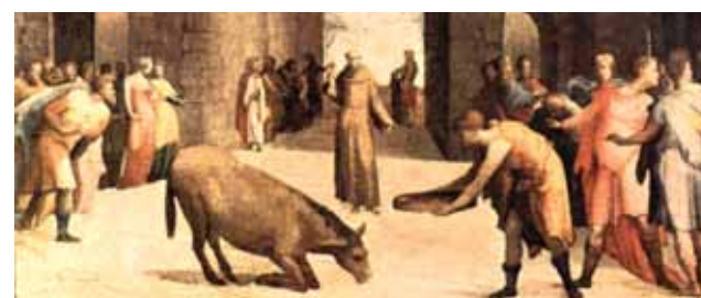
Domenico Beccafumi, Sankt Antonius und das Wunder des Esels (1537), Louvre, Paris