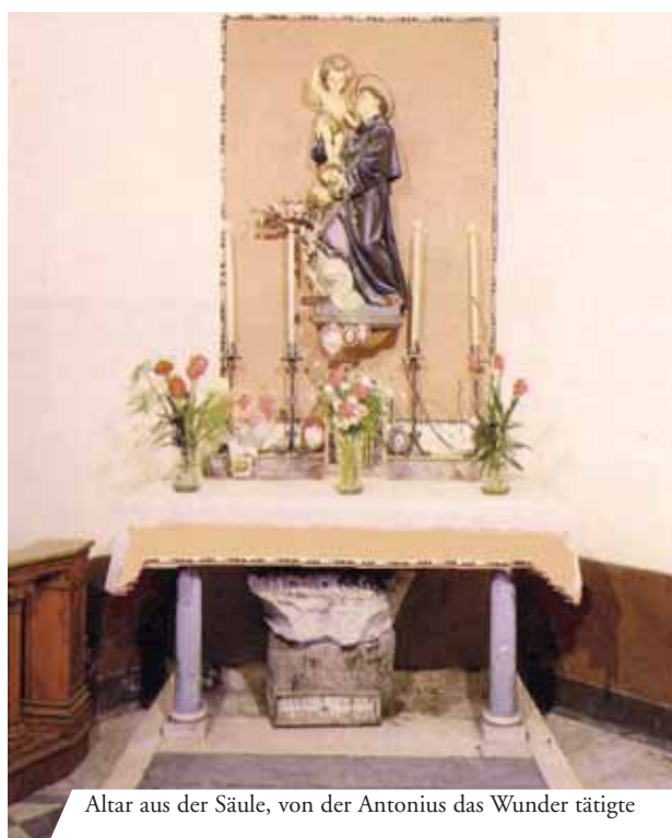
Altar aus der Säule, von der Antonius das Wunder tätigte