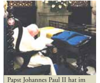
Papst Johannes Paul II hat im Jahr 2000 das liturgische Fest der Barmherzigkeit eingeführt, es wird jährlich den ersten Sonntag nach Ostern gefeiert

Jesus zur Heiligen Faustina: „Meine Tochter, hilf Mir einen sterbenden Sünder zu retten, bete für ihn den Rosenkranz, wie Ich es dich gelehrt habe“. Als ich dann zu beten begann, sah ich den Sterbenden in einem fürchterlichen Kampf. Sein Schutzengel war machtlos gegen die Ärmlichkeit seiner Seele und viele Dämonen warteten auf den Sterbenden. Doch, während ich betete, wie mir geheißen, erblickte ich Jesus, wie er im Bild dargestellt ist. Die Strahlen kamen aus seinem Herz und umhüllten den Todkranken, so mussten die Dämonen flüchten. Der Mensch starb in Frieden. Als ich erwachte, verstand ich, dass dieser Gebetskranz wichtig neben Todgeweihten ist, denn er stillt Gottes Zorn. (Heilige Faustine Kowalska, Tagebuch, Libera Editrice Vaticana, Seite 515)