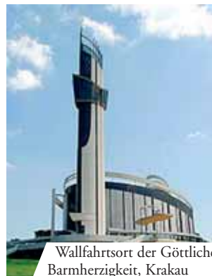
Wallfahrtsort der Göttlichen Barmherzigkeit, Krakau