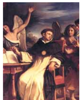
G. Francesco Barbieri, dit le Guercino. Saint Thomas d'Aquin écrit assisté par les Anges (1662)