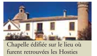
Chapelle édiflée sur le lieu où furent retrouvées les Hosties