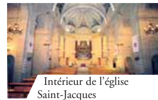
Intérieur de l'église Saint-Jacques