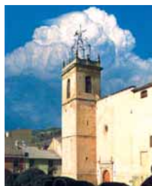
Église Saint-Jacques apôtre à Onil où est conservée l'Hostie miraculeuse