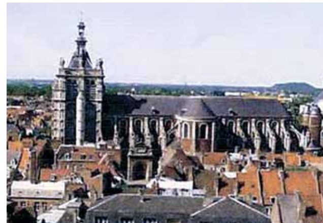
Façade externe de l'église Saint-Pierre à Douai