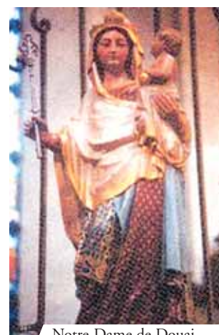
Notre-Dame de Douai