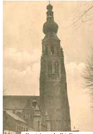
Extérieur de l'église Sainte-Catherine, Hoogstraten

Boxtel est célèbre surtout pour un Miracle qui eut lieu autour de 1380. Un prêtre nommé Eligio Van der Aker était en train de célébrer la Messe devant l'autel des Rois Mages. Après la consécration il renversa par mégarde le calice contenant le vin blanc consacré qui se transforma en Sang et tacha le corporal et la nappe de l'autel. La Relique du corporal taché est encore aujourd'hui conservée à Boxtel, tandis que la nappe fut donnée à la ville de Hoogstraten. Le document le plus important qui décrit le Miracle est un décret écrit en 1380 par le Cardinal Pileus.