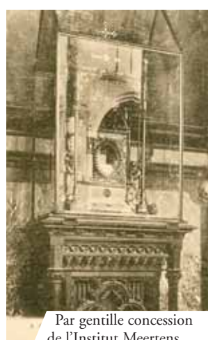
Par gentille concession de l'Institut Meertens