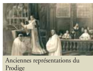
Anciennes représentations du Prodigé