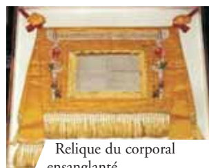
Relique du corporal ensanglanté