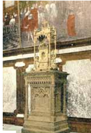
Relique du sang du Prodigé, église Sainte-Catherine