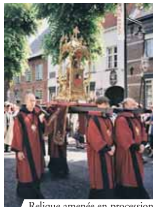
Relique amenée en procession