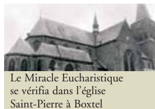
Le Miracle Eucharistique se vérifia dans l'église Saint-Pierre à Boxtel