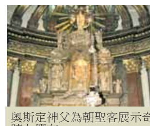
奧斯定神父為朝聖客展示奇蹟九摺布。