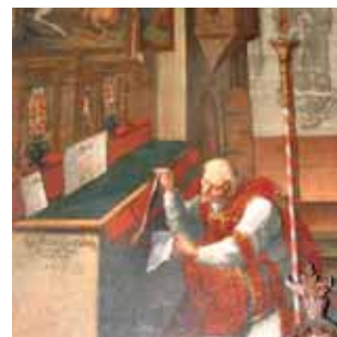
Otto神父將發生奇蹟的九摺布藏起來。這幅畫繪於1732年，現保存在聖喬治堂。