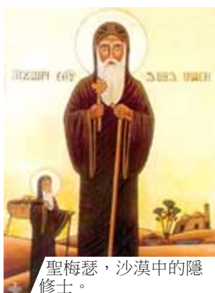
聖梅瑟，沙漠中的隱修士。