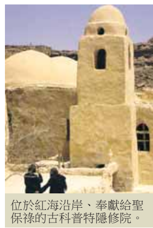
位於紅海沿岸、奉獻給聖保祿的古科普特隱修院。