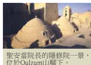
聖安當院長的隱修院一景，位於Qulzum山腳下。