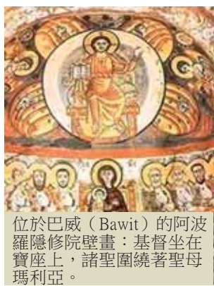
位於巴威 (Bawit) 的阿波羅隱修院壁畫：基督坐在寶座上，諸聖圍繞著聖母瑪利亞。