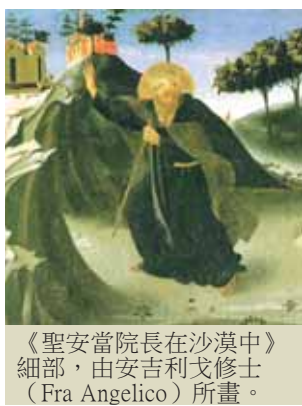
《聖安當院長在沙漠中》細部，由安吉利戈修士 (Fra Angelico) 所畫。