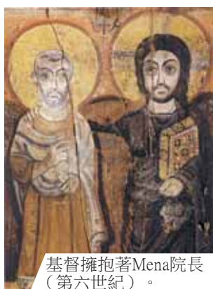
基督擁抱著Mena院長（第六世紀）。