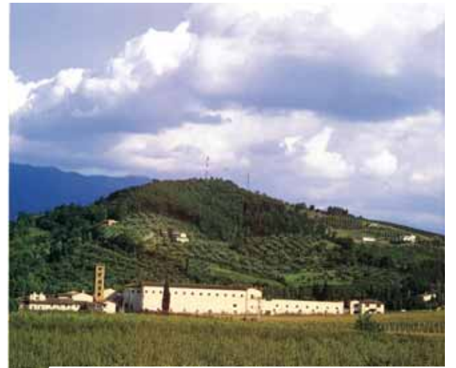
根據教堂正面一個十七世紀製作的碑文，羅撒諾聖瑪利亞隱修院成立於780年。