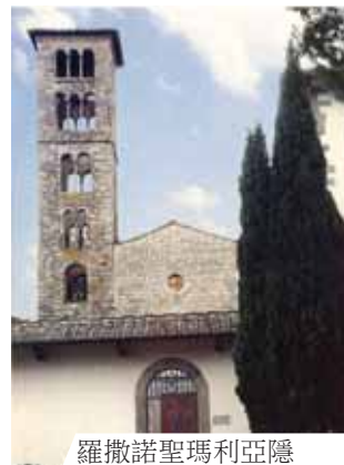
羅撒諾聖瑪利亞隱修院正門。