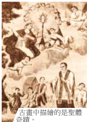
古畫中描繪的是聖體奇蹟。