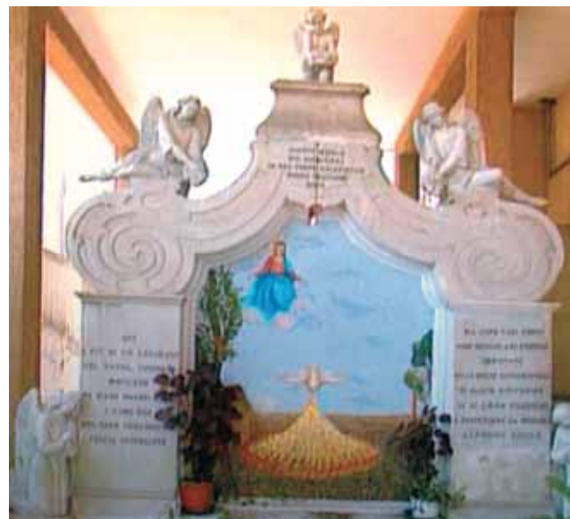
在尋回聖體之地所建的石碑。