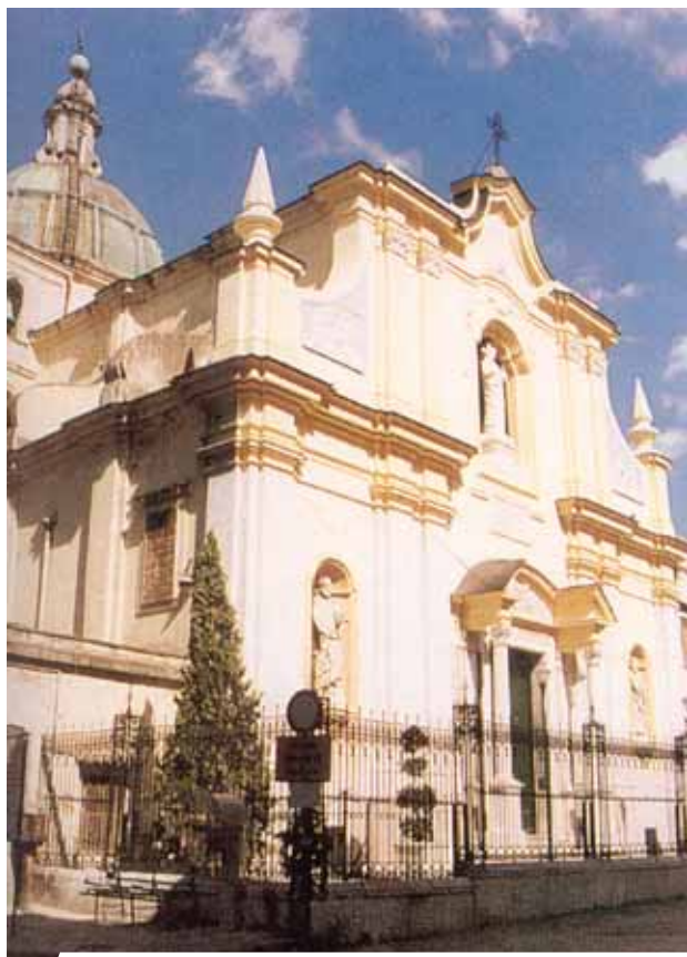
柏天勞的聖伯多祿堂。

1772年2月24日，柏天勞聖伯多祿聖堂內的聖體被偷走，但又奇蹟似地找回，並保存至今。1774年的8月29日，宗座對這個難以解釋的聖跡表達了關切之意。宗座宣布1971年是教區的聖體年，以便教區各團體更了解聖體聖事的意義。不幸地，1978年時，小偷偷走了聖物盒，裡面包括於1772年發生奇蹟的聖體。