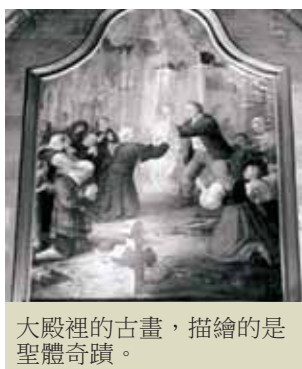
大殿裡的古畫，描繪的是聖體奇蹟。