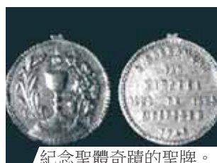
紀念聖體奇蹟的聖牌。