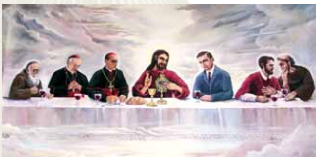
Marijan Jakubin所畫的《耶穌的最後晚餐》。 存放於盧布瑞格奇蹟聖血聖殿。