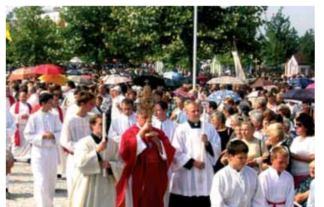
每年九月舉行遊行。在那一週當中，人們慶祝發生的奇蹟，當地稱為Sveta Nedilja (聖主日)。