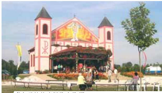
盧布瑞格的奇蹟聖血聖殿。

1721年， Eleonore Batthyany- Strattman公 爵夫人下令 將未變質、 完好如初的 聖血保存在 聖體光中。