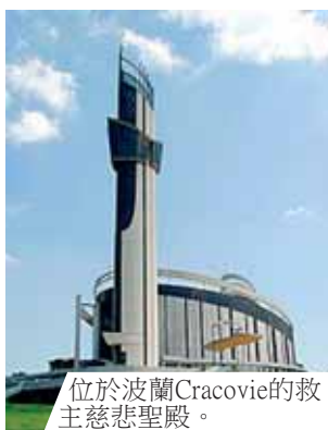
位於波蘭Cracovie的救主慈悲聖殿。