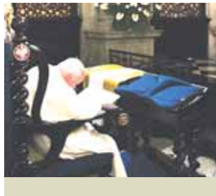
若望保祿二世於2000年宣布每年復活節後第一個主日為救主慈悲主日。