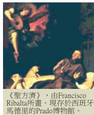
《聖方濟》，由Francisco Ribalta所畫。現存於西班牙馬德里的Prado博物館。