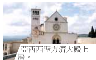
亞西西聖方濟大殿上層。