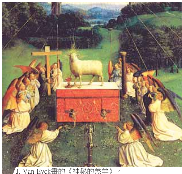
J. Van Eyck畫的《神秘的羔羊》。