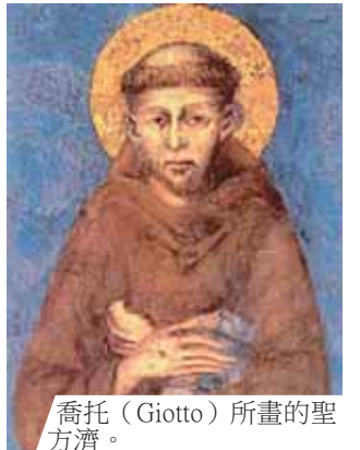
喬托 (Giotto) 所畫的聖方濟。