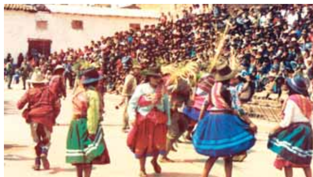
特別的節日以紀念嬰孩耶穌。