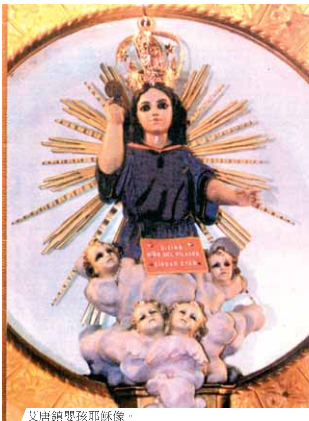
艾唐鎮嬰孩耶穌像。

秘魯艾唐鎮的聖體奇蹟發生在356年前的艾唐港。正當公拜聖體時，聖體中顯現了嬰孩耶穌和三顆相連結的心，並發出白光。每一年，從7月12日起直至24日，為了慶祝這次的聖體奇蹟，人們帶著嬰孩耶穌的雕像，由聖殿出發一直走到艾唐鎮。