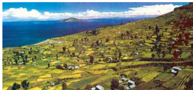
提提喀喀湖 (Lake Titicaca)