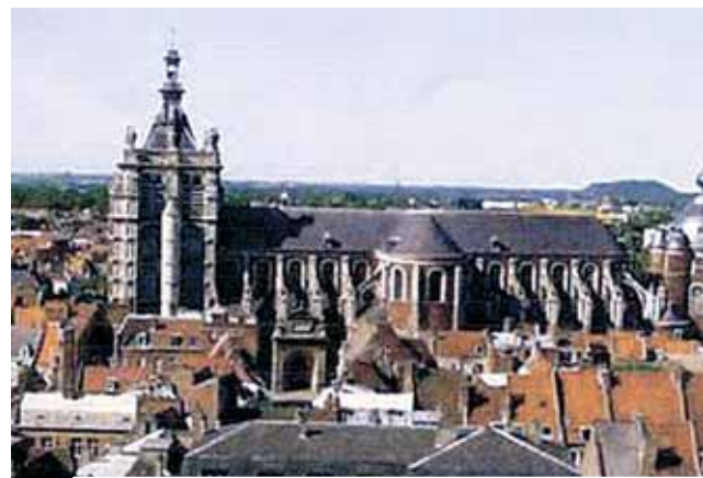
杜艾聖伯多祿堂的正面外景。