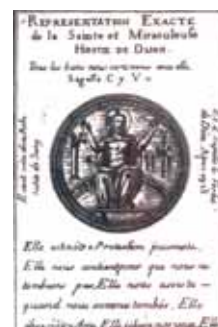
發生在第戎的聖體 (此為製作精細的複製品)。