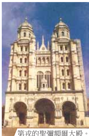
第戎的聖彌額爾大殿。