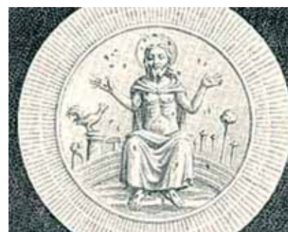
這塊聖體於1433年時，由教宗恩仁四世送給勃艮第的菲力普公爵 (第戎)。

事，甚至將發生奇蹟的聖體送給勃艮第的菲力普公爵 (Duc Philippe de Bourgogne)，而菲力普公爵再轉贈給第戎市。很確定的是直至1794年為止，聖體依然保留在總領天使聖彌額爾大殿，然而同年的2月9日，第戎市政府徵收教堂，獻給一個名為「理性之神」(La Raison) 的新教派。許多文件及藝術作品都描述了這個奇蹟，例如第戎主教座堂其中一塊鑲嵌玻璃上，描繪了這次奇蹟的主要情節。